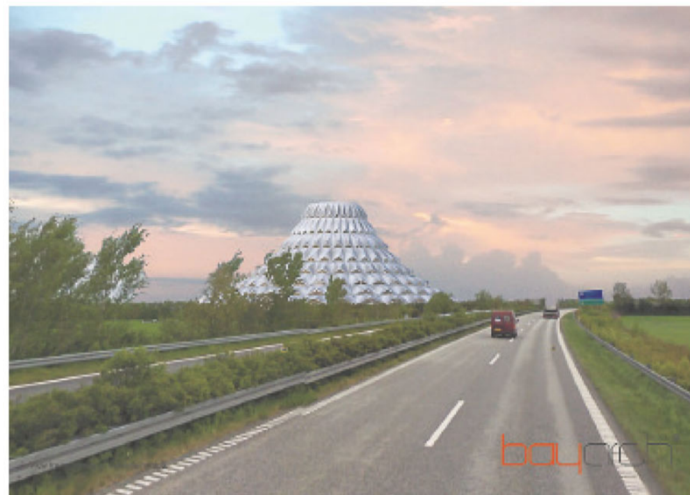
ILLUSTRATION: BAY ARCH

“Teknikkens Univers” kan blive turismens