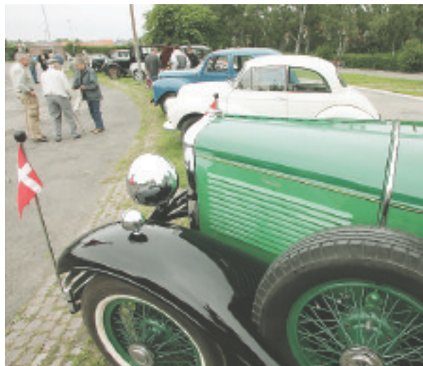
"Teknikkens Univers" skal blandt andet sende veteranbiler med turister ud på vejene.

- Først og fremmest skal vi dog være stolte af landsdelen - og så vise det til resten af verden. pnf